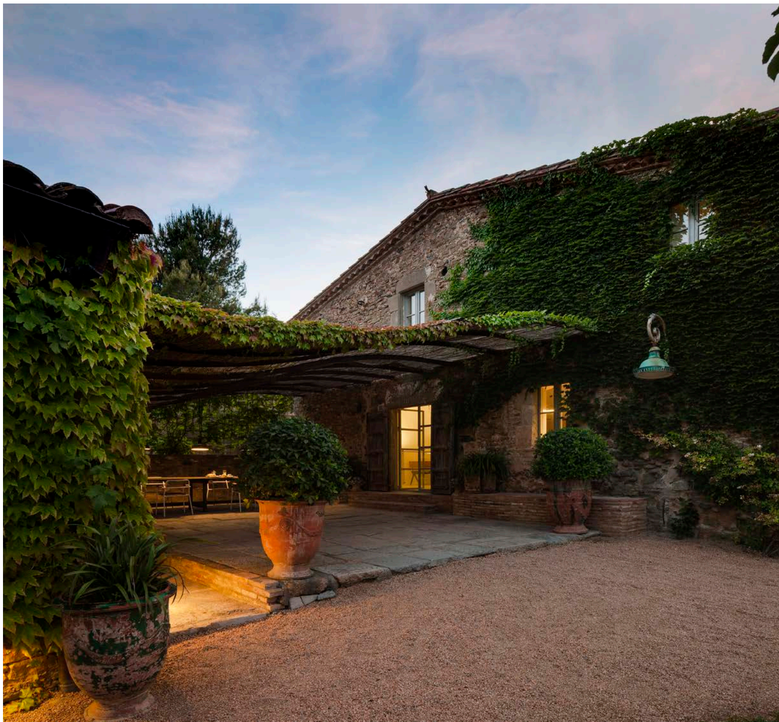
CASA DE CAMPO Foixà Baix Empordà